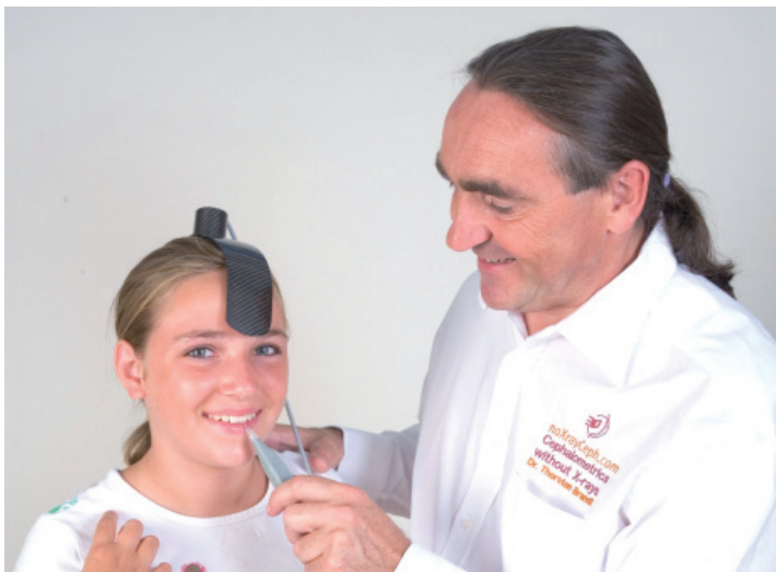
Abb.3: Mit dem Messstift wird der anatomische intra- und extraorale Messpunkt angesteuert und mit dem Auslöser registriert.