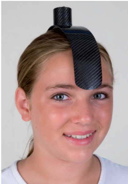
Abb.2: Die Karbon-Kopfkappe für die Magentkephalometrie in Position