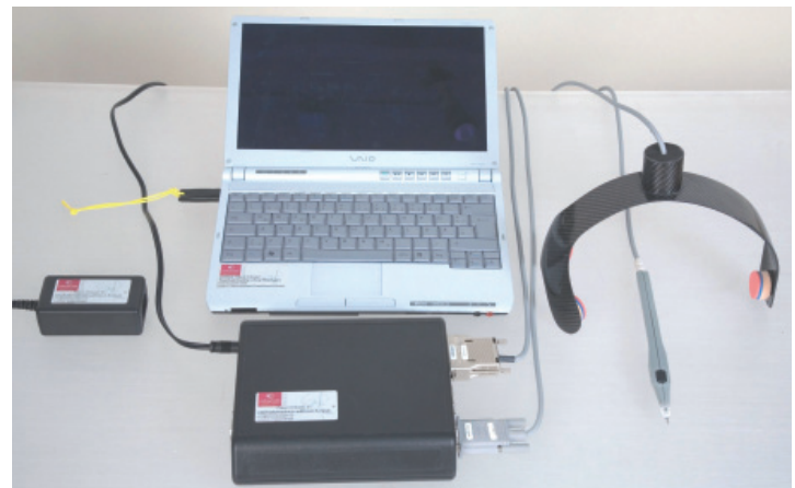
Abb.1: Die Komponenten des noXrayCeph-System

Die Grundbestandteile des Systems sind folgende: